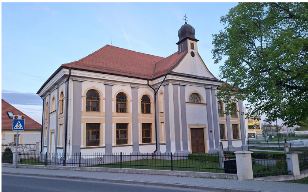
• Kostol CZ ECAV v Dunajskej Lužnej v roku 2026.